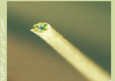
الصورة: دي. بي. أي. فكتوريا